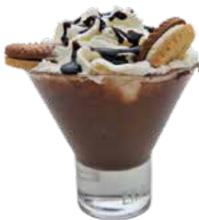
Tentazione Ringo Caffè, cioccolato, panna, biscotto Ringo