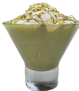
Tentazione Pistacchio Caffè, variegato panna biscotto al pistacchio