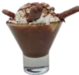
Tentazione Togo Caffè, cioccolato, panna biscotto Togo