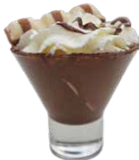
Tentazione Kinder Caffè, Nutella, panna, kinder