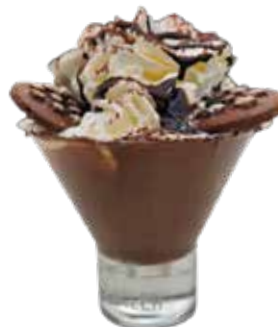
Tentazione Pan di Stelle Caffè, cioccolato, panna, biscotto Pan di Stelle