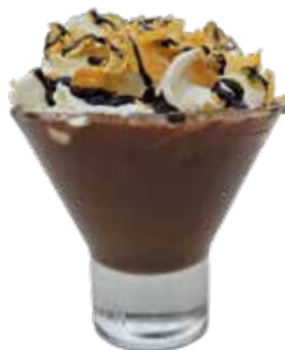
Tentazione Cereali Caffè, panna, cioccolato cereali, biscotto